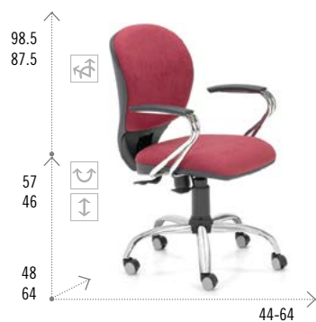
Modelo RIOTA 200