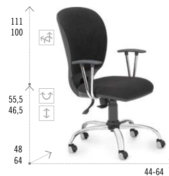
Modelo RIOTA 210