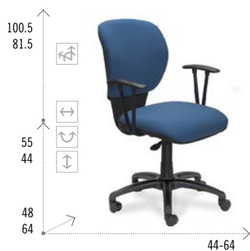
Modelo RIOTA 200