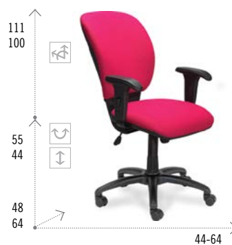
Modelo RIOTA 210